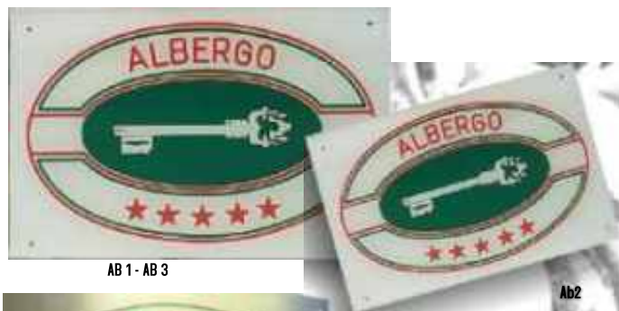
AB 1 - AB 3